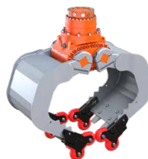
optionale 4-Grip Ansteckvorrichtung, hier angebaut an einem A06HPX